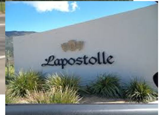
Sala de Ventas – Viña Lapostolle