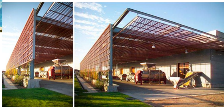
Viña Los Vascos nuevas oficinas