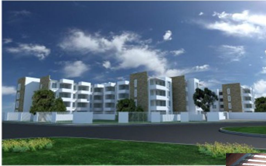
Edificio Solar del Parque Talca