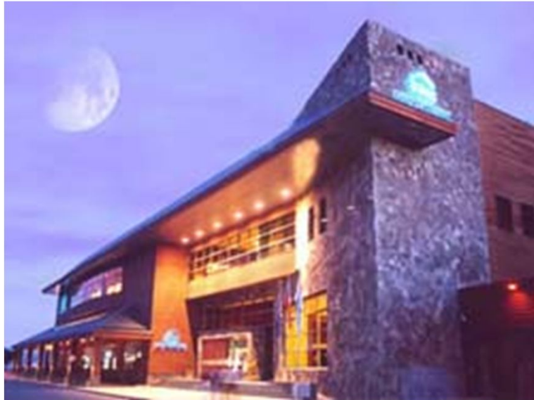
Ampliación Casino Puerto Varas