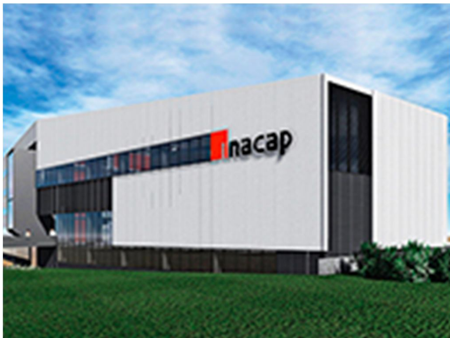
Ampliación Inacap Curicó