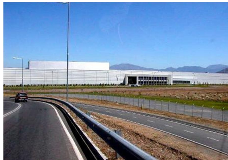
SUPERCERDO Planta Rosario (nuevas oficinas)