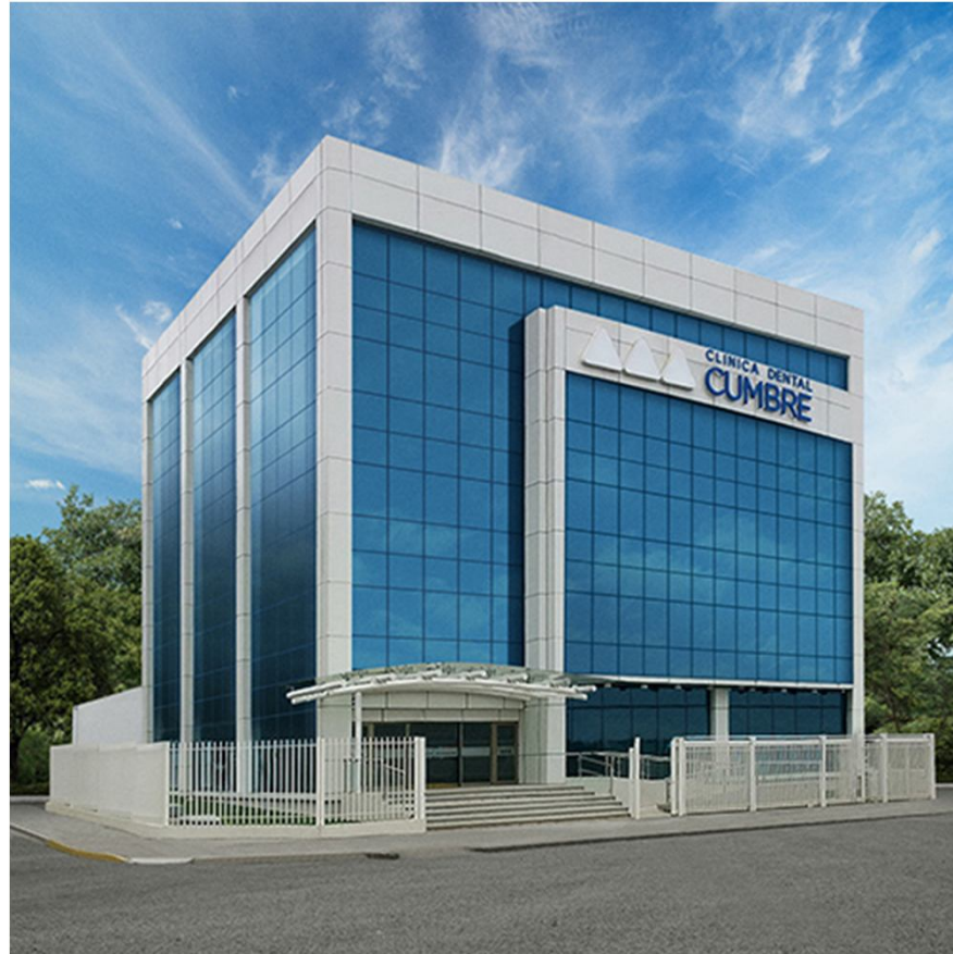
Clínica Cumbres La Serena