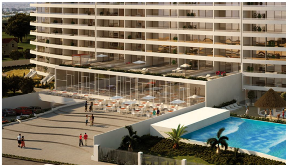
Restaurante Mia Pizza La Serena