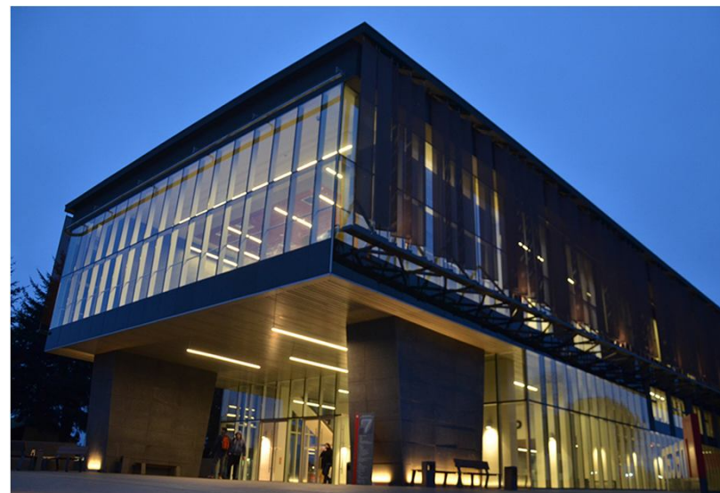
Ampliación y Mantenimiento Inacap Valdivia