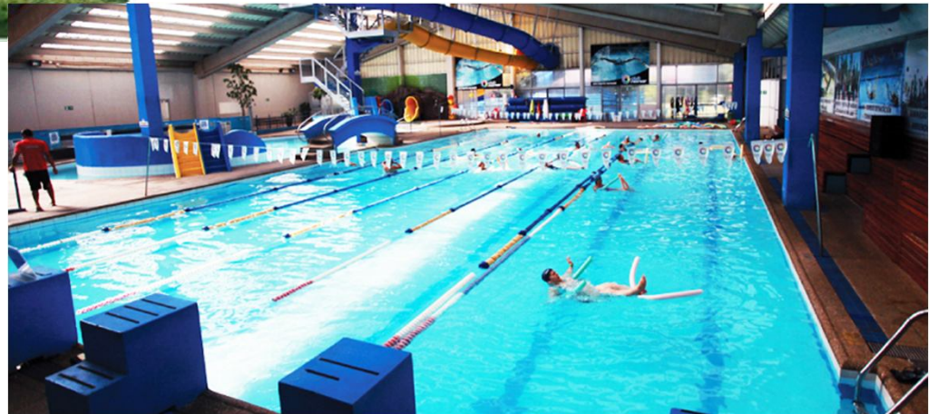
Piscina Recrear - Quilín