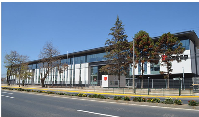
Inacap Talca (Mantenimiento y ampliaciones)